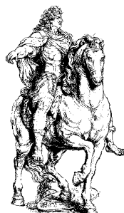
Louis XIV bientôt à Bergues...