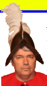
L'un des « emplumés... »