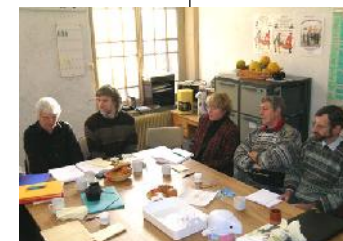
Réunion régionale à Bergues le 15/01/2005

Au titre des nouveautés pour 2009, des stages régionaux sont envisagés.