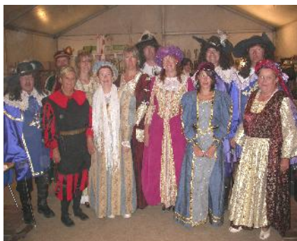
Une partie de la Troupe des Baladins Troubadours en attente de leur première entrée sur le terrain...

L'escouade n'aura jamais été si nombreuse : 15 personnes, ayant de 3 à 6 rôles ! Il faut mieux ne pas traîner dans les coulisses pour l'habillage et le déshabillage car c'est un peu court ! Il est vrai que nous sommes aidés puisque deux Baladines nous servent de costumiers.