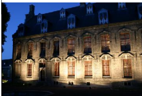
Facade arrière du musée lors de la Nuit des Musées