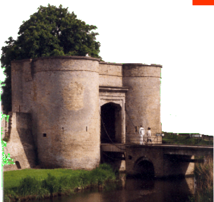
La Porte de Bierne - XVème siècle

Nombreuses Possibilités d'hébergement ou de restauration à Bergues même ou dans les environs immédiats (hôtels, restaurants, chambres d'hôtes estaminets, pizzerias, gîtes ruraux)